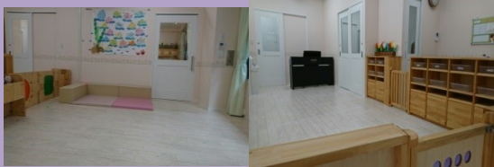
おしゃれな白の木目CFシートの広々とした保育室