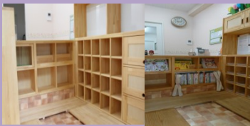
木の受付玄関です。 献立ケース・掲示板等 全てオーダーメイド