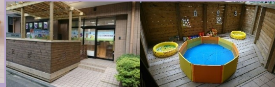
ぶどうの見えるデッキで 水遊びです!