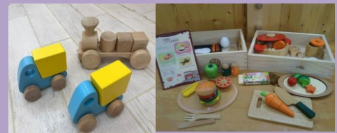
人肌に近い温かみのある 木のオモチャで遊ぼう。