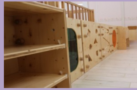
木と遊ぼう(家具) ミラーパネル・ブロック パネル等で遊べる間仕切り