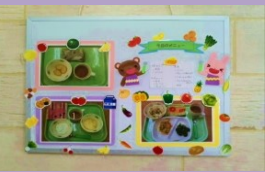
当法人のオリジナル食育 献立にて給食・おやつを ご提供しています。