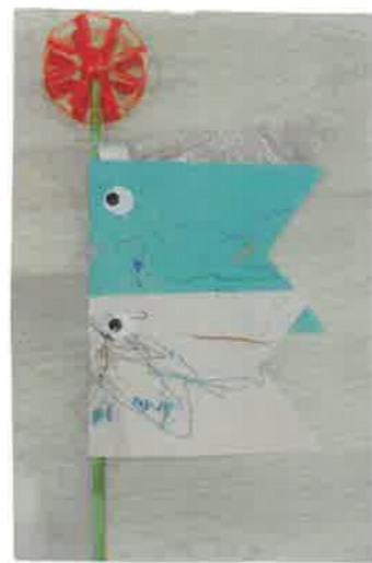
クヨンを使ってこいのぼりにたこさんおえかきを楽しみました。色んな色があるね!!

★ 園の玄関での置きがさはできません。お持ち帰りくださいまませうお願っしませう。