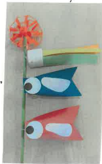
うこの部分に足形をペったんこ。"大きくなあれ〜"と願っながら、上手にできましたよ!!

登園初日は、初めてお母様から離れ、ドキドキと戸惑いから、うわ〜んと泣き玩具を使い遊ぶ事が出来なかった子ども達も、入園し1か月が過ぎキラキラした玩具・曲が流れる玩具・ボールなど好きな玩具も決まり、体を動かし遊んでいます。隣のお部屋から、歌が聴こえてくると、手をたたいたり、手足をバタバタと喜んでいます。日々の成長が早い子ども達の様子を多く伝えて行きたいと思っ折ります。今日は、お散歩を少しずつ取り入れて行きたいと思っ折ります。